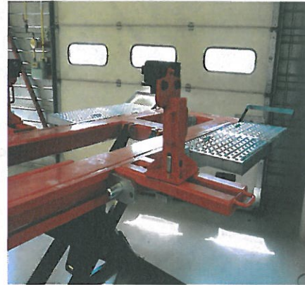
Anchoring Ancrage Ankerung

Straightening commercial, 4WD and passenger vehicles is easy thanks to the ramps and the quick-release clamps Le redressage de véhicules léger, vans et 4x4 est facilité grâce aux rampes d'accès et aux pinces d'ancrage à desserrage rapide