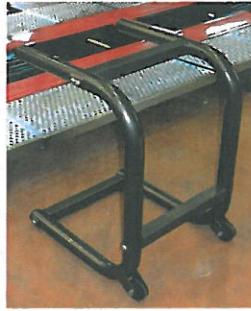
Wheel stand Chandelle Unterstellbock