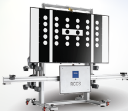
TEXA RCCS 3 BT