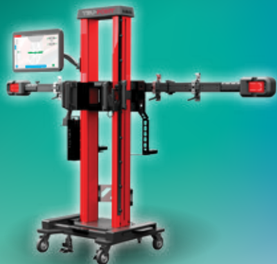
SNAP ON TRU-POINT