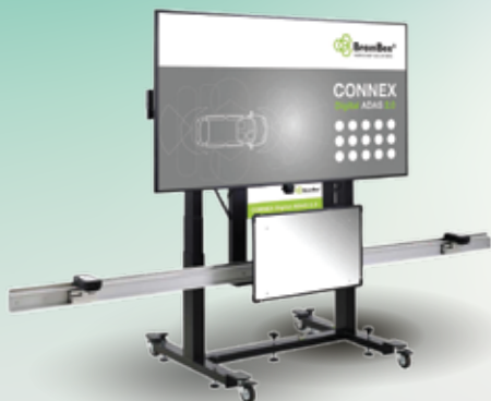
BRAIN BEE DIGITAL ADAS 2.0